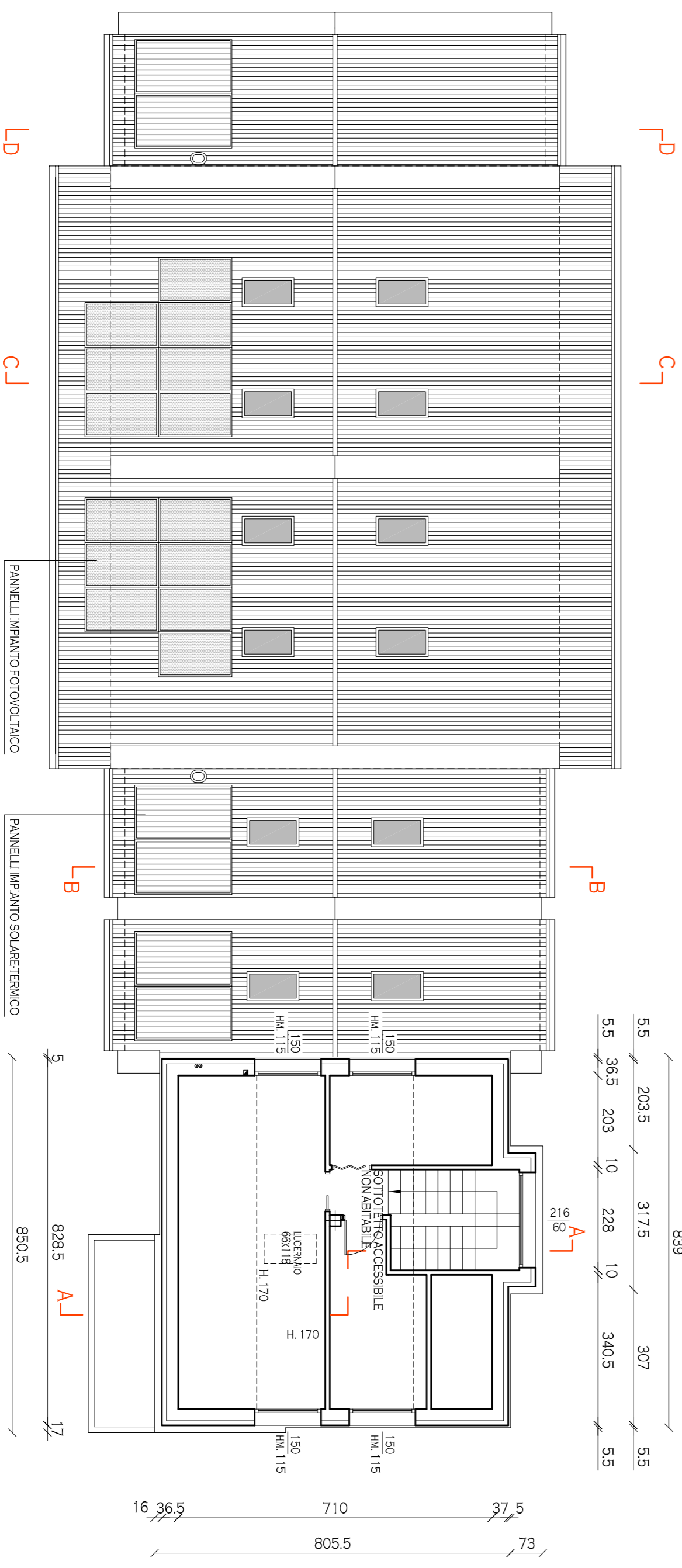
PIANTA PIANO SOTTOTETTO